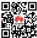
华为企业业务官方APP

了解华为存储更多信息，请联系当地代表处或者访问华为企业业务官方网站 http://e.huawei.com 。